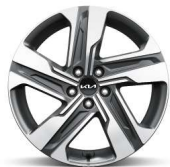
Jante aliaj 19"